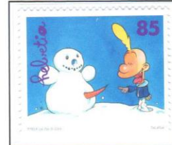
Aber bitte nicht so!