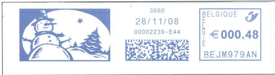
Der Schneemann schaut fröhlich.