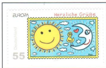
Die Sonne scheint – es wird wärmer.