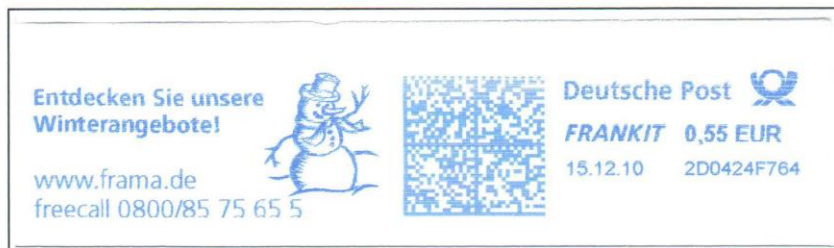
Er sackt langsam in sich zusammen.