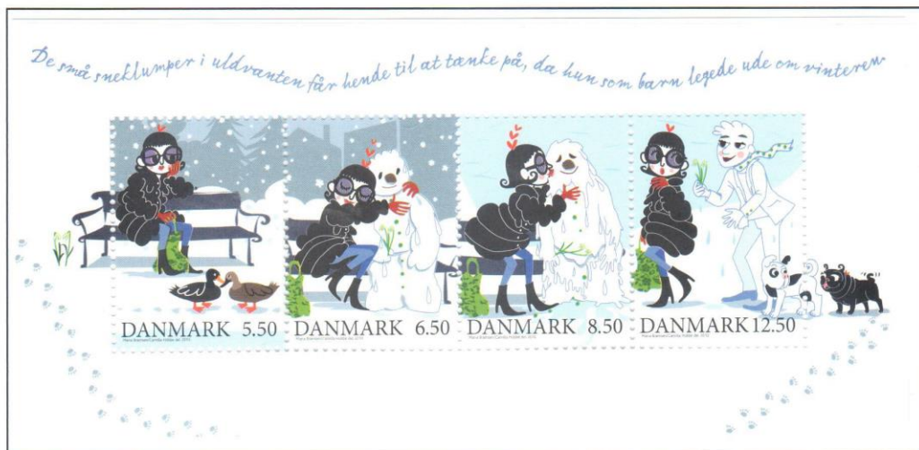
Jetzt heißt es Abschied nehmen – Tschüss, bis nächsten Winter!