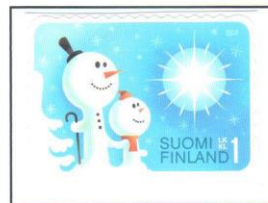
Der Schnee schmilzt, die Schneemänner nehmen ab.